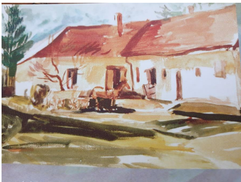
Nagy László akvarellje a szülői házról