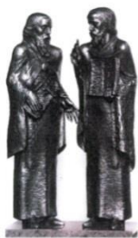
Bolgár Kulturális Intézet

A Bolgár Kulturális Intézet és a Darik Rádió tisztelettel meghívja Önt